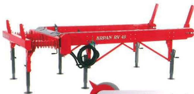
Längs- und Querförderer RV 45