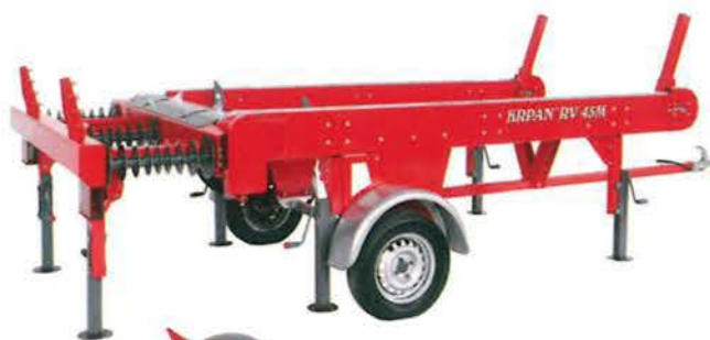
Längs- und Querförderer RV 45 M