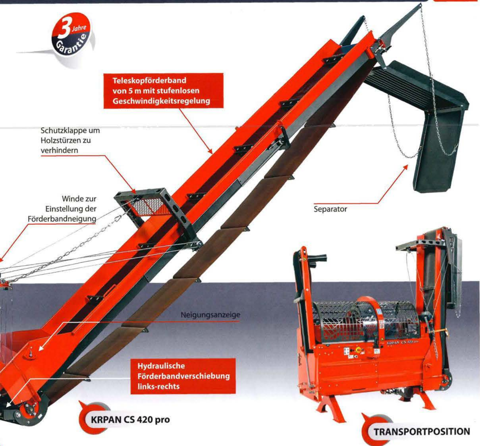
KR PAN CS 420 pro