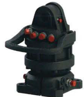
Rotator mit integriertem Flansch