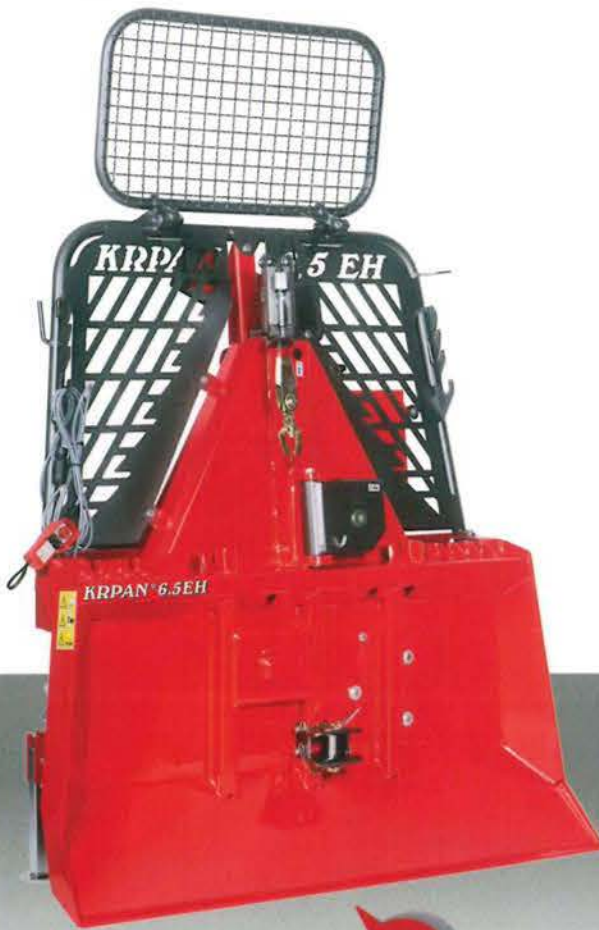
KR PAN 6,5EH