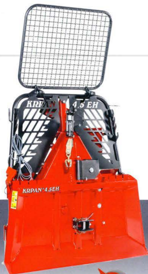
KR PAN 4,5EH