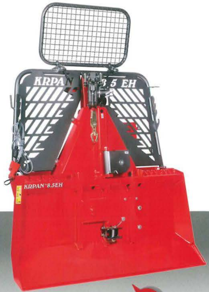
KR PAN 8,5EH