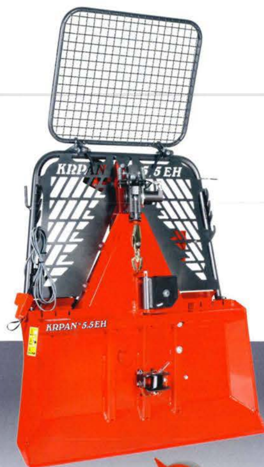
KR PAN 5,5EH